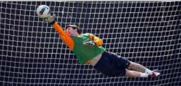
လေ့ကျင့်ရေးကွင်းတွင် မက်ဆီဂိုးဖမ်းနေသည့်ပုံကို ပူပိုင်းလက်၏ Twitter စာမျက်နှာတွင်ဖော်ပြထားစဉ်

ပြောခဲ့သည်။ ၎င်းက“ မက်ဆီသည် လူပုလေးတစ်ဦးသာ ဖြစ်သော်လည်း ဂိုးဖမ်းအလွန်ထူးချွန်ကြောင်းနှင့် နိုင်ငံပင်ပစ်ရာတွင် အလွန်ပေါ့ပါးမျက်လက်ကြောင်းလည်းချီးကျူးခဲ့သည်။