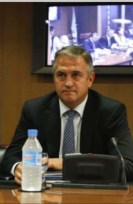
စပိန်ဘောလုံးအဖွဲ့ချုပ်(LFP)ဥက္ကဋ္ဌ ဟိုဆေးလ်လူးဝစ်အက်စတီယာလာရန်

အစိုးရသို့အခွန်ငွေသန်း(၆၀၀)ကျော်ပေးဆောင်ရမည်ဖြစ်ပြီး၊ ပြီးခဲ့သည့် (၄)နှစ်တာကာလအတွင်း ယူရိုသန်း(၁၅၀)ခန့်ထပ်မံတိုးမြှင့်လာခဲ့ကြောင်း အချို့အသင်းများသည် ဘဏ္ဍာရေးပြဿနာကြုံတွေ့နေရသော်လည်းအသင်းအတော်များများမှာ ယင်းအခွန်ငွေများကိုပေးဆောင်နိုင်မည့်အနေအထားတွင်ရှိနေသည်ကိုစစ်ဆေးတွေ့ရှိပြီးဖြစ်ကြောင်း အစိုးရတာဝန်ရှိသူတစ်ဦးက ပြန်လည်ဖြေကြားခဲ့သည်။ သို့ရာတွင် စပိန်မီဒီယာများကမူ အခွန်