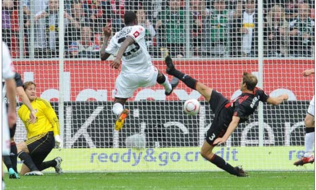
ပြီးခဲ့သည့်ရာသီက လေဗာကူဆင်ကွင်းတွင် လေဗာကူဆင်နှင့် မိုချန်ဂလာဘတ်တို့ တွေ့ဆုံခဲ့စဉ် (ယင်းပွဲတွင် မိုချန်ဂလာဘတ်က ၆-၃ ဂိုးဖြင့် အနိုင်ရရှိခဲ့သည်)