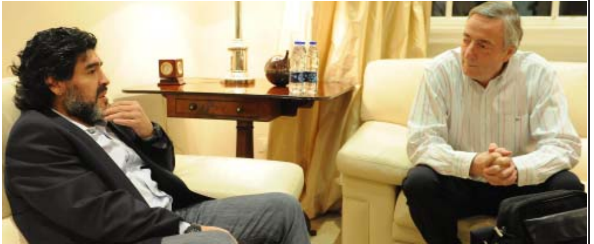
မာရာဒိုနာအား အာဂျင်တီးနားသမ္မတဟောင်း Nestor Kirchner မကွယ်လွန်မီကအတူ တွေ့ရစဉ်

ဂျူဗင်တပ်စ်အသင်း၏ အီတလီဝါဂ်တိုက်စစ်မှုအယ်လီယာရီသည် တစ်နှစ်ပြည့်ပြောက်ခဲ့ပြီဖြစ်သည့်ဆန်ဒိုင်းလျင်အတွက် လျူဒါန်းမှုများပြုလုပ်ခဲ့ကြောင်းသိရှိရသည်။ အယ်လီယာရီကယူရို(၂၀၀၀၀)လုံးခန့်တန်ကြေးရှိသည့် ငွေနှင့်အတတ်အထည်များကိုလျူဒါန်းခဲ့ပြီး ဂျူဗင်လျင်နုတ်သက်တံအချက်အလက်တွေကိုကျွန်တော်မယူဝင်တွေ့မှာ ဖတ်ရပါတယ်။ သူတို့ရဲ့ စိတ်ဓာတ်ကြံ့ခိုင်မှုကိုလည်း လေးစားပါတယ်” ဟုဆိုခဲ့သည်။