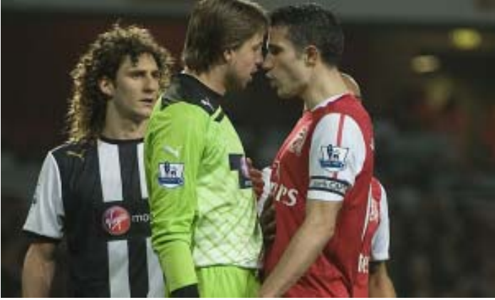
ပွဲချိန်အတွင်း တင်မ်ကရူးလ်နှင့် ပန်ပါစီတို့ နှစ်ဦးရင်ဆိုင်တွေ့နေစဉ်

ပွဲအပြီးအဝတ်လဲခန်းသွားရာလမ်းတွင်လည်း နှစ်ဖက်ကစားသမားများအချင်းများခဲ့