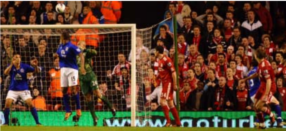
အဲဗာတန်ဘက်သို့ ပထမဂိုးသွင်းယူနေသည့် လီဗာပူးလ်အသင်းခေါင်းဆောင်ဂျရတ်

ပ ရီး မီး ယား လိဂ် ပွဲ ကျန် သုံး သပ် ချက်