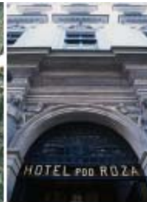
အင်္ဂလန်အသင်းတည်းခိုမည့် ဟိုတယ်နှင့်ကိုက်(၂၀၀)အကွာတွင်ရှိသော Hotel Pod Roza

တွေကို သူတို့ရဲ့WAG တွေနဲ့တွေ့ဆုံခွင့်ကို တင်းတင်းကျပ်ကျပ်ပိတ်ပင်ထားဖြစ်လိုက်ပါတယ်။ ကစားသမားတွေအနေနဲ့ ဘောလုံးအပေါ်မှာပဲ အာရုံစူးစိုက်မှုအပြည့်ရှိစေဖို့ ကာပယ်လိုကစီစဉ်ခဲ့တာဖြစ်ပေမယ့်လက်တွေ့မှာတော့ ကာပယ်လိုရဲ့မှန်းချက်ကလွဲချော်ခဲ့ပါတယ်။