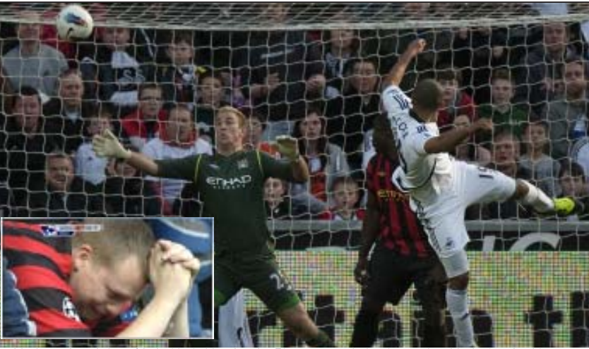
မန်စီးတီးအသင်းဘက်သို့ လှန်မိုးခေါင်တိုက်ဂိုးသွင်းချက်(ပုံကြီး) ရှုံးပွဲအတွက်ဝမ်းနည်းနေသည့် မန်စီးတီးပရိသတ်တစ်ဦး(ပုံသေး)

တောင်ပံကောင်းတော့ တိုက်စစ်ကစားပုံပုံကောင်းလာပြီး မာရီယိုဂိုးမက်စ်အတွက် အခွင့်အလမ်းကောင်းတွေပေါ်ခဲ့သည်။ ဒီတော့ ဟော်ဖန်ဟင်ခ်ကို ရိုးမက်စ်ဟက်ထရစ်သွင်းပြီး ဘောလုံးမြူးနှစ် (၇-၁)ရိုးမြှင့်နိုင်ခဲ့သည်။ ဘောလုံးမြူးနှစ်ရဲ့ ဂိုးသွင်းနှုန်းက တစ်ပွဲတည်းနှင့် ရပ်မသွား။ ချန်ပီယံလိဂ်မှာစွမ်းရည်ကောင်းကိုထပ်ပြခဲ့သည်။ ရော်ဘင်၊ ဂျာနာရီတောင်ပံနှစ်ဖက်က ဟော်ဖန်ဟင်ခ်နဲ့ပွဲက ခြေစွမ်းမျိုးပြန်ပြန်ခဲ့သလို မာရီယိုဂိုးမက်စ်က (၄)ရိုးထပ်သွင်းခဲ့ပြန်သည်။ ရုပ်လုံးပေါ်လာတဲ့ စီးရီးအေ ဗြိတိန်မသားဖြစ်ခဲ့သည့် စီးရီးအေက တဖြည်းဖြည်းနှင့် ရုပ်လုံးပေါ်လာခဲ့သည်။ အေစီမီလန်က ခြေစွမ်းမန်ယူနဲ့ဖြင့် ခုတ်မောင်းနေချိန်မှာ ဂျူဗင်တပ်စ်ရဲ့ အမှားအယွင်းတွေက အခွင့်အရေးပေးသလိုဖြစ်နေသည်။ မှူးပေမယ့် မိုင်တာနစ်နာလှသည်။ (၅)ပွဲသာရကျလျှင် (၁၀)မှတ်ဆုံးရသည့်အနေအထားက အေစီမီလန်အမှတ်တွေဆက်တိုက်ယူနိုင်တော့ ဂျူဗင်တပ်စ်ကို ပြတ်ကျန်စေခဲ့သည်။ စီးရီးအေအကြောင်းပြောတော့ အင်တာဗီလန်ကိုလည်း မေ့မထားချင်။ ချန်ပီယံလိဂ်မှာ အဝေးကိုးစည်းမျဉ်းနှင့်ထွက်လိုက်ရသည်က စိတ်ပျက်စရာ။ ရာနီရေရီရဲ့အသင်းတွေက ဒီလိုအခက်ကောင်းမလိုလိုနှင့် အဖျားရှူးသွားလေ့ရှိသည်။ (၁၀)ရိုးဆိုတဲ့အနေအထားကို ရောက်ပြီးမှ လက်ကျန်(၁၅)မိနစ်ကို ထိန်းမထားနိုင်ခြင်းက ဒီလိုအဖြစ်မျိုးကို ကြုံတွေ့စေခြင်းဖြစ်သည်။ ပယ်နယ်တီကနေအနိုင်ရိုး ပြန်ရပေမယ့် ဘာမှအသုံးမဝင်တော့။