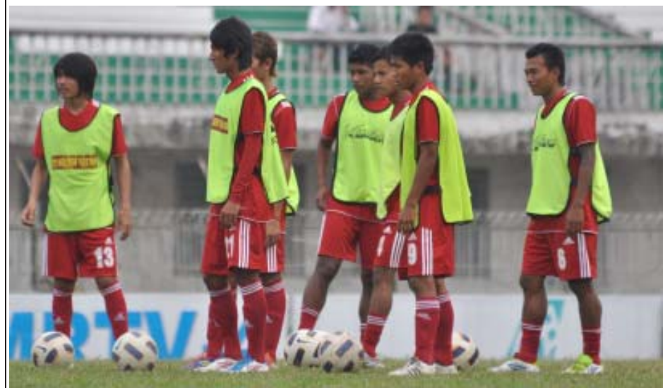
ဘူနိုင်းဘုရင့်ဖလားပြိုင်ပွဲဝင်ရောက်ယှဉ်ပြိုင်ခဲ့သည့် မြန်မာယူ-၂၂ကစားသမားများ