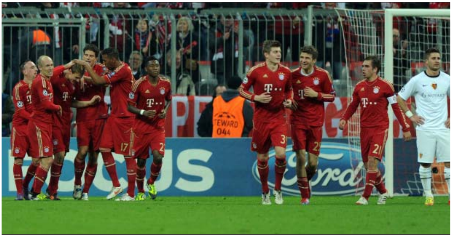
ဘောဆယ်အသင်းကို (၇)ရိုးပြတ်အနိုင်ယူခဲ့ပြီး နောက်ဆုံး(၂)ပွဲတွင် (၁၄)ရိုးအထိ သွင်းယူနိုင်ခဲ့သည့် ဘောလုံးမြူးနှစ်အသင်းသားများ

ဦးဆောင်သူအပြောင်းအလဲ ရာသီကုန်ခါနီးမှာ ပရီးမီးယားလိဂ်အမှတ်ပေးယောထိပ်ဆုံးနေရာ အပြောင်းအလဲ ဖြစ်ခဲ့သည်။ မန်ယူရဲ့ အစဉ်အလာကြောင့် လျော့တွက်လိုမသည့်အတိုင်းအမှန်တကယ် ဖြစ်လာခဲ့ခြင်းဖြစ်သည်။ မန်စီးတီးရဲ့ ဖြတ်သန်းမှုကို ပြန်ကြည့်တော့ ဒီနှစ်မှချန်ပီယံ လောင်းစာရင်းထဲ ဝင်လာသည့်အသင်းလို တောင် မထင်ရ။ ခြေစွမ်းလည်းမရှိသည်။ ခြေစွမ်းလည်းကောင်းသည်။ ဒါပေမယ့် ပွဲကျပ်တွေကို ပွတ်ကာသိကာ၊ ဝေကာရိုက်ကာ မန်ယူကျော်ဖြတ်ပြလာတော့ မန်စီးတီး ရှေ့ကပြောရင်း စိုးရိမ်လာပုံရသည်။ ပြီးတော့ ဖီအားဝင်လာသည်။ နောက်ဆုံးကျတော့ ခြေခေါက်လဲကျခဲ့ခြင်းဖြစ်သည်။ မန်ယူနိုင်သွားသည့်ပွဲထက် မန်စီးတီး ရှုံးခဲ့သည့်ပွဲအကြောင်းကို အရင်ပြောချင်သည်။ မန်စီးတီးမှာ ပြဿနာတွေရှိသည်ဆိုလျှင် ခံစစ်ကိုပထမဆုံးထောက်ပြရမည်။ ခံစစ်မှာမှ ဆာပစ်က အဓိကပြဿနာဖြစ်သည့်ဆာပစ်ရဲ့အနေအထားကပထမကစားသမားနေရာအတွက် မှော်လင့်ခွင့်မရှိ။ ဒါပေမယ့်နည်းပြမစ်စီနီက လိုအပ်လျှင်လိုအပ်သလို ထည့်သုံးတတ်သည်။ ထည့်သုံးတိုင်းလည်း ပြဿနာတက်သည်။ သူ့အမှားတွေကြောင့် ပေးခဲ့ရသည့်ရိုးတွေကမနည်းတော့။ ဆွမ်းဆီးနဲ့ပွဲမှာလည်း သူရဲ့ လူပေအမှားက နေတစ်ဆင့် ဆွမ်းဆီးရသွားခြင်းဖြစ်သည်။ ရာသီအဆုံးသတ်ကာလတွေမှာ ခြေစွမ်းအရ ရော့၊ ကံကြမ္မာပိုင်းအရပါအရေပါပြီး အမှားလုပ်၍မရ။ ဒီလိုအချိန်မျိုးမှာ မန်စီနီလူရွေးမန်စီလိုသည်။ ဆုံးဖြတ်ချက်မန်စီလိုသည်။