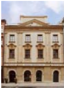
အင်္ဂလန်လက်ရွေးစင်အသင်းတည်းခိုမည့် ကရကောမြို့ရှိ Hotel Stary

အဲဒါရစ်ဆင်ဟာ သူ့ကိုယ်တိုင် သူ့ရဲ့ချစ်သူ အီတလီလူမျိုးနန်စီနဲ့ အတူရှိခဲ့သလို၊ အင်္ဂလန်ကစားသမားတွေကိုလည်း သူတို့ရဲ့ WAG တွေနဲ့ လွတ်လွတ်လပ်လပ်တွေ့ခွင့်ပေးခဲ့တာကြောင့် အင်္ဂလန်ကစားသမားတွေ အသင်းအပေါ် အာရုံစူးစိုက်မှုလျော့နည်းပြီး ရှုံးနိမ့်ခဲ့ရတယ်လို့ အင်္ဂလန်ပရိသတ်တွေကမှတ်ယူခဲ့ပါတယ်။ အဲကြောင့် WAG တွေအပေါ် ဝေဖန်မှုတချို့ရှိခဲ့ပြီး ၂၀၁၀ကမ္ဘာ့ဖလားပြိုင်ပွဲမှာတော့ အင်္ဂလန်လက်ရွေးစင်ကစားသမားတွေဟာ ယခင်ကမ္ဘာ့ဖလားပြိုင်ပွဲနဲ့မတူတဲ့ အခြေအနေကိုကြုံတွေ့ခဲ့ရပါတယ်။ ၂၀၁၀ ကမ္ဘာ့ဖလားပြိုင်ပွဲမှာ စည်းကမ်းတင်းကျပ်တဲ့ အီတလီလူမျိုးနည်းပြကာပယ်လိုကိုယ်တိုင်ကန့်သတ်ပြီး ကာပယ်လိုက ၂၀၀၆သင်္ခန်းစာကိုယူကာ အင်္ဂလန်လက်ရွေးစင်ကစားသမား