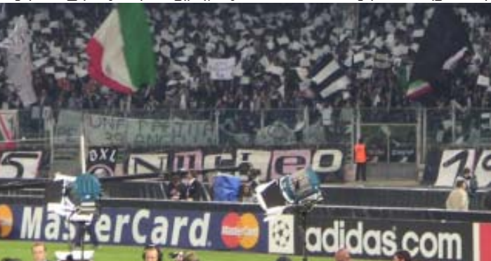
နာပိုလီအသင်းအတွက်ပရိသတ်များသည် ဂျူဗင်တပ်စ်ပရိသတ်များအား ပွဲစဉ်တစ်ခုတွင်တွေ့ရစဉ်

သို့ရာတွင် ယင်းကတ်ပြားများ နှင့်ပတ်သက်၍မသမာမှုများရှုပ်ထွေးမှုများရှိနေသဖြင့် လာမည့်ရာသီတွင် အစီအစဉ်သစ်တစ်ခုအစားထိုးမည်ဟုဆိုခဲ့သည်။