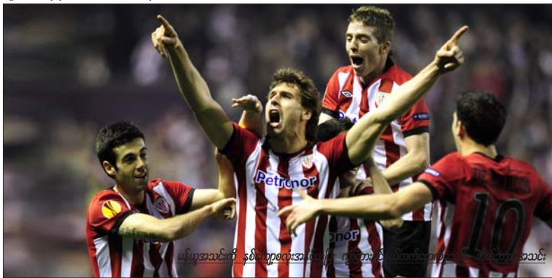
မန်ယူအသင်းကို နှစ်လကျော်အကြာမှာ ပြန်တက်လာခဲ့တဲ့ ဘီလ်ဘာအိုအသင်း

ကြောင်းကို အန္တရာယ်မပေးနိုင်ခဲ့ဘဲ၊ ဂိုးသွင်းခွင့်လည်းအနည်းငယ်သာရရှိခဲ့ပါတယ်။ ဘိလ်ဘာအိုအသင်းကတော့ ပထမအကျော့ကပုံစံအတိုင်းပဲ၊ လျင်လျင်မြန်မြန် ထိုးဖောက်ကစားခဲ့ပြီး ကွင်းလယ်ကစားသမားဒီမားကွိုစ်က မန်ယူနောက်တန်းကို