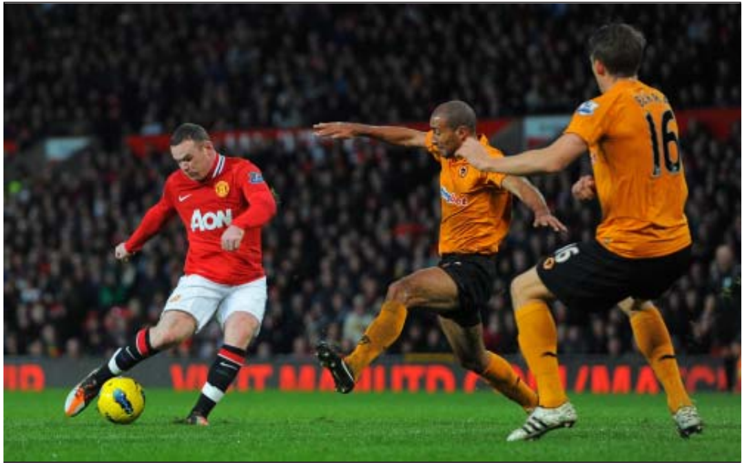
ပထမအကျော့ ပွဲစဉ်တွင် ရွှေနီ၏ ကန်သွင်းချက်အား တားဆီးရန် ကြိုးစားနေသည့် ဂုလ်ပ်နောက်ခံလူများ

ပရီးမီးယားလိဂ်ပွဲစဉ်(၂၉)အကြိုသုံးသပ်ချက်