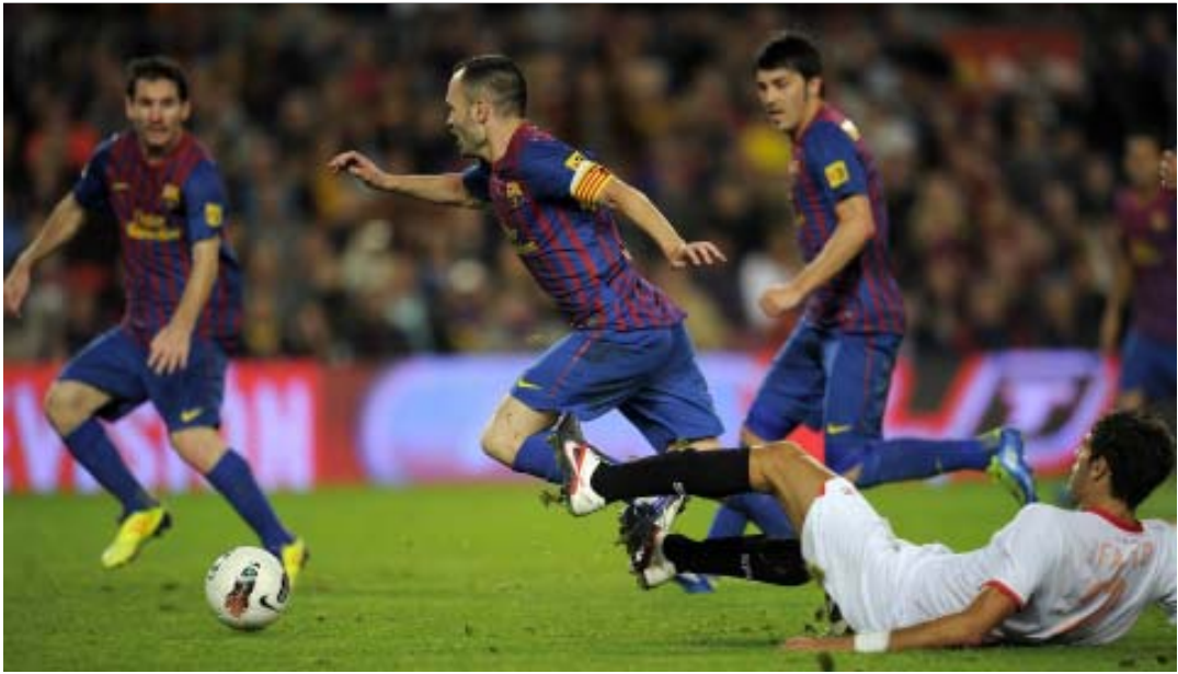
ပထမအကျော့ဆုံတွေ့ခဲ့စဉ်က အင်နီယောစတာ၏ထိုးဖောက်မှုကို ဆီဗီလာနောက်ခံလူဟယ်ယိုတားဆီးနေစဉ်

လာ လီ ဂါ ပွဲ စဉ် (၂၈) အ ကြို သုံး သပ် ချက် လူသန့်အေး