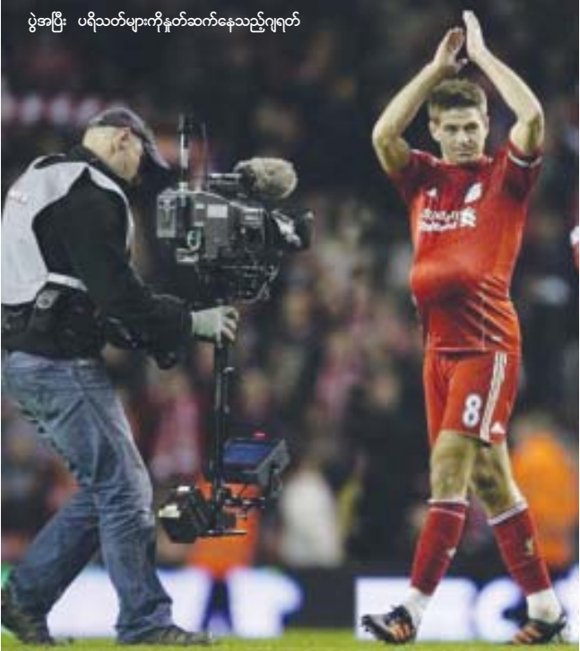
ပွဲအပြီး ပရီသတ်များကိုနှုတ်ဆက်နေသည့်ဂျရတ်