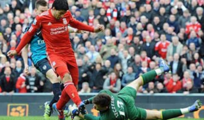
ဆွာရက်ဒ်တိုးဖောက်လာသောဘောလုံးကို အာဆင်နယ်ဂိုးသမားဆင်ကစီကကွယ်နေစဉ်

ရှိရပြီး ဒဲဂလစ်ရှ်က အာဆင်ဝင်းဂါး၏စွပ်စွဲပြောဆိုမှုကိုဒေါသထွက်နေခြင်းဖြစ်သည်။