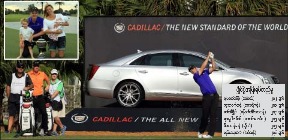
ကျင်းနံပါတ်(၁၃)တွင် တီဒိုမှ စရိုက်နေသည့် ဂျပ်စတင်းရိုက်(ပုံကြီး)နှင့် ပွဲအပြီးမိသားစုနှင့်အတူအောင်ပွဲခံနေစဉ်(ပုံသေး)

“မာစတာပြိုင်ပွဲအစီ တိုက်ဂါး ဒဏ် ရာကင်းစင်စေဖို့မျှော်လင့်ပြီး အဲဒီမှာသူနဲ့ထိပ် တိုက်ယှဉ်ပြိုင်လိုတာအမှန်ပါ။ သူဟာဂေါက် သီးလောကရဲ့ ပြယုဂ်တစ်ခုဖြစ်သလို၊ သူ့လို ကစားသမားမျိုး နောက်ထပ်မရှိနိုင်ပါဘူး”ဟု ကမ္ဘာ့နံပါတ်(၁) မြောက်အိုင်ယာလန်ဂေါက် သီးသမား မက်အီရှင်းကပြောကြားခဲ့သည်။ WGC-Cadillac Championship ပြိုင်ပွဲတွင် ဆု ကြေးအမေရိကန်ဒေါ်လာ (၈၀၅)သန်း ချီးမြှင့်ခဲ့ပြီး ဂျပ်စတင်းရိုက်က ဒေါ်လာ(၁၀၄) သန်းရရှိခဲ့သည်။