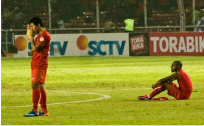
တက္ကသိုလ်အကျဉ်းချုပ်များနှင့် သည်။ ရင်ခွင်နေရသည် အင်ဒိုနီးရှားဘောလုံး အသင်း၊ အဖွဲ့ချုပ် (PSSI) မှာ ရင်းတိုဗီအာကီအေခဲ စူပါလိဂ်၊ များကိုယ်ကျင့်နိုင်ပါက ဖီစာဗ်အရေယူ နိုင်ငံအသင်း၊ မှုနှင့်ရင်ဆိုင်ရမည်ရန်နေကြောင်းသိရသည်။ ခဲရု အသင်း၊ အင်ဒိုနီးရှားအသင်းသည် ပြီးခဲ့သည့် (IPL)ဝင်၊ ၂၀၁၄ခုနှစ်ကွာလေးခြေစွဲစွဲ တတိယအ သည်၊ ဆင့်တွင် အုပ်စုချောင်းဆုံပွဲစဉ်အကုန်ရန်၊ ယင်းသို့ အသင်းကို (၁၀)ရက်ပြတ်ခွင့် အကုန်တက် ရန်မခွင့်ရဘဲ အင်ဒိုနီးရှားဘောလုံးအဖွဲ့ချုပ် မှာ အကြီးအကျယ်ပြတ်ဝင်ဝေဖန်ခံခဲ့ရ မည်။

သည်။ ဘာဂီနိန်းပွဲတွင် အင်ဒိုနီးရှား အသင်း၏ အဓိက ကစားသမားများမှာ စူပါလိဂ် (ISL) ပွဲတွင်မျှော်လင့်ရန်ရှိသူများ နိုင်ငံအသင်းတွင်ပါဝင်ကစားနိုင်ခြင်း မရှိခဲ့ရာ အင်ဒိုနီးရှားဖီဖီဒီယားလိဂ်ပြိုင်ပွဲ (IPL) ဝင်အသင်းများမှ အတွေ့အကြုံမရှိသည့် လူငယ်များပါဝင်ကစားခဲ့၍ ယခုကဲ့သို့ အရှက်ကဏ္ဍသို့မရှိနိုင်ခဲ့ခြင်းဖြစ်ပြီး ယင်းပွဲအပြင်တွင် အင်ဒိုနီးရှားအမျိုးသမီးဘောလုံးအဖွဲ့ချုပ်ကို ဘာလွှာငွေထောက်ပံ့မှုများရပ်ဆိုင်းခဲ့ကြောင်းလည်းသိရသည်။ အင်