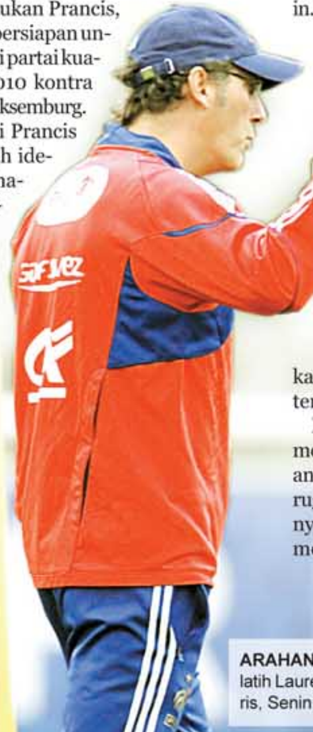
ARAHAN —Karim Benzema (kanan) mendengarkan arahan pelatih Laurent Blanc saat sesi latihan di Clairefontaine, selatan Paris, Senin (4/10).

Ini bukan kali pertama Benzema dikritik oleh Blanc. Sebelumnya sang pelatih pernah mempertanyakan kebiasaan diet sang pemain. Belum lama ini Benzema juga mendapat kritik dari arsitek Real Madrid, Jose Mourinho. Sang pelatih meminta Benzema memperlihatkan penampilan yang lebih berkarakter. □ JIBI/SOLOPOS/yms