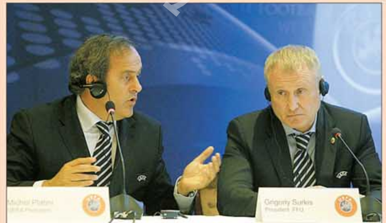
KONFERENSI PERS —Presiden UEFA, Michel Platini (kiri) dan Presiden Federasi Sepak Bola Ukraina, Grigoriy Surkis, saat jumpa pers di Minsk, Senin (4/10).

MINSK —Komite Eksekutif UEFA, Selasa (5/10) dini hari WIB, telah menyetujui jadwal resmi pertandingan Euro 2012. Turnamen akbar di Polandia dan Ukraina itu dibuka pada 8 Juni di Warsawa dan partai puncak digelar pada 1 Juli 2012 di Kiev.