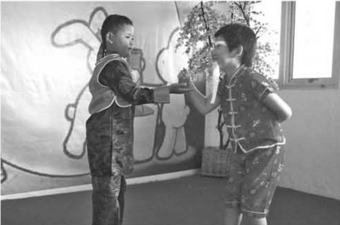
IST DRAMA: Sekelompok siswa-siswi SD Bhinneka Tunggal Ika National Plus tengah mementaskan drama mengenai Dewi Bulan.