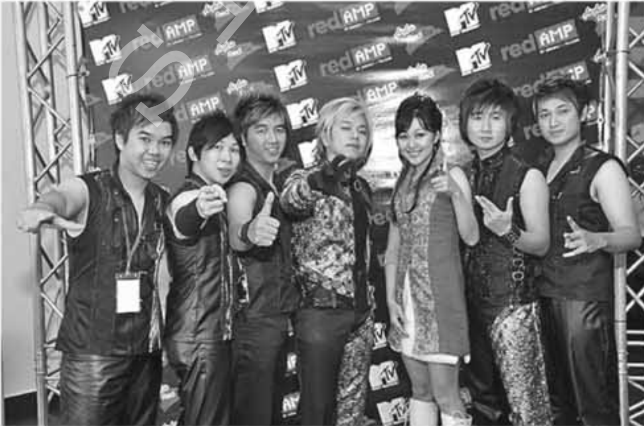
IST LAGU MANDARIN: Para personel Golden Dragon Band berfoto bersama. Kelompok band ini bisa dikatakan satu-satunya kelompok musik yang menekuni lagu Mandarin.