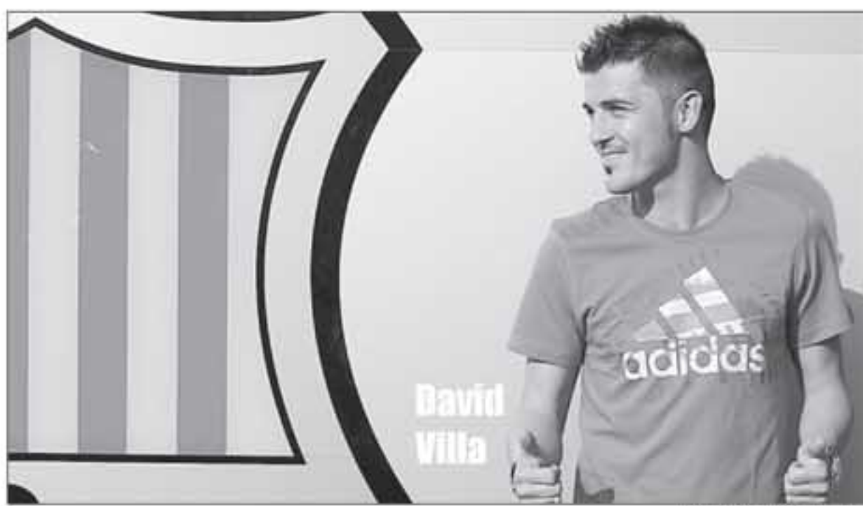
DAVID VILLA —Striker Barcelona, David Villa, dalam aksi di lapangan.

BARCELONA —Langkah Barcelona pada awal musim ini kurang begitu mulus. Namun striker David Villa membantah adanya krisis di tubuh El Barca setelah timnya hanya membukukan skor imbang 1-1 dua kali beruntun kontra Rubin Kazan dan Real Mallorca.