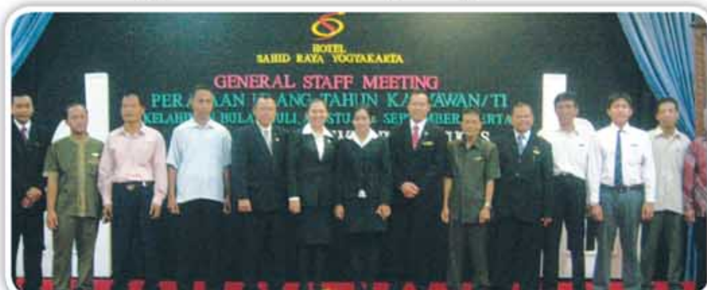
Karyawan/wati kelahiran Bulan Juli - September bergembira ria dalam acara Perayaan Ulang Tahun Bersama

Management Hotel Sahid Raya Yogyakarta menggelar 4 acara yang dikemas dalam satu kesatuan event cantik dan menarik. General Staff Meeting, Perayaan Ulang Tahun Karyawan/