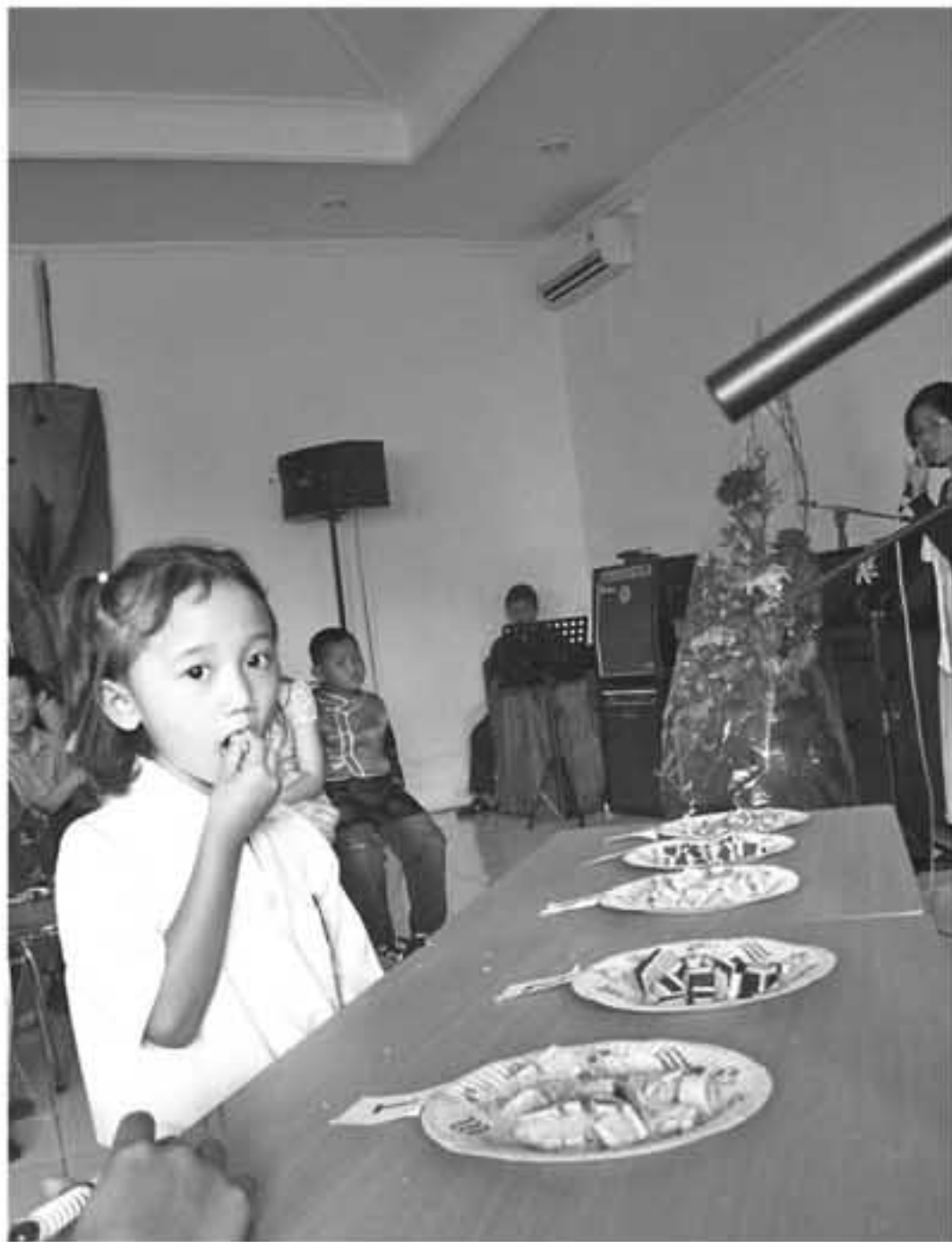
IST CICIP: Seorang siswa SD Bhinneka Tunggal Ika National Plus tengah mengikuti perlombaan mencicipi kue bulan.

gencar. Apalagi, dengan disetujuinya perdagangan bebas AC-FTA. Sebagian produk yang beredar di Indonesia berasal dari RRC. Mau tidak mau, bahasa Mandarin menjadi salah satu bahasa bisnis yang harus dikuasai. “Di Indonesia masih kesulitan mencari guide ketika ada turis dari RRC datang. Ini sebenarnya peluang juga, jumlah warga RRC terbesar di dunia. Jika mereka datang ke Indonesia dan terfasilitasi, kan menguntungkan untuk industri pariwisata juga,” imbuh Iman. Untuk itu, pengembangan bahasa Mandarin tak hanya untuk kepentingan pengetahuan semata. Akan lebih berguna jika pengembangan bahasa Mandarin bisa diarahkan untuk komunikasi dalam dunia bisnis.