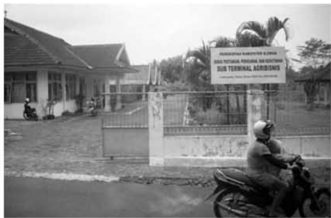
Kondisi sub terminal agribisnis Lumbungrejo yang terlihat sepi.

Ia sendiri mengakui proposal awal yang disodorkan Pemkab awalnya cukup menggiurkan. Diperkirakan jika sesuai masterplan sub terminal tersebut akan menghasilkan pendapatan Rp2 miliar di tahun ke tiga (2005). Tahun ini seharusnya sub terminal ter-