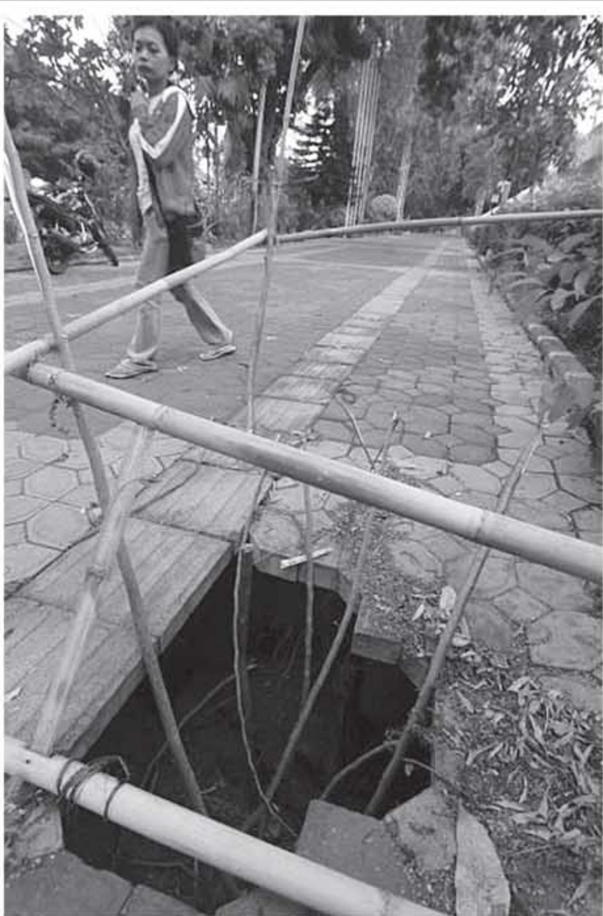
CITYWALK RUSAK: Sebagian permukaan citywalk di Jl Slamet Riyadi, Solo, Selasa (5/10) ambles. Kerusakan dikhawatirkan akan semakin parah bila tidak segera dilakukan perbaikan.