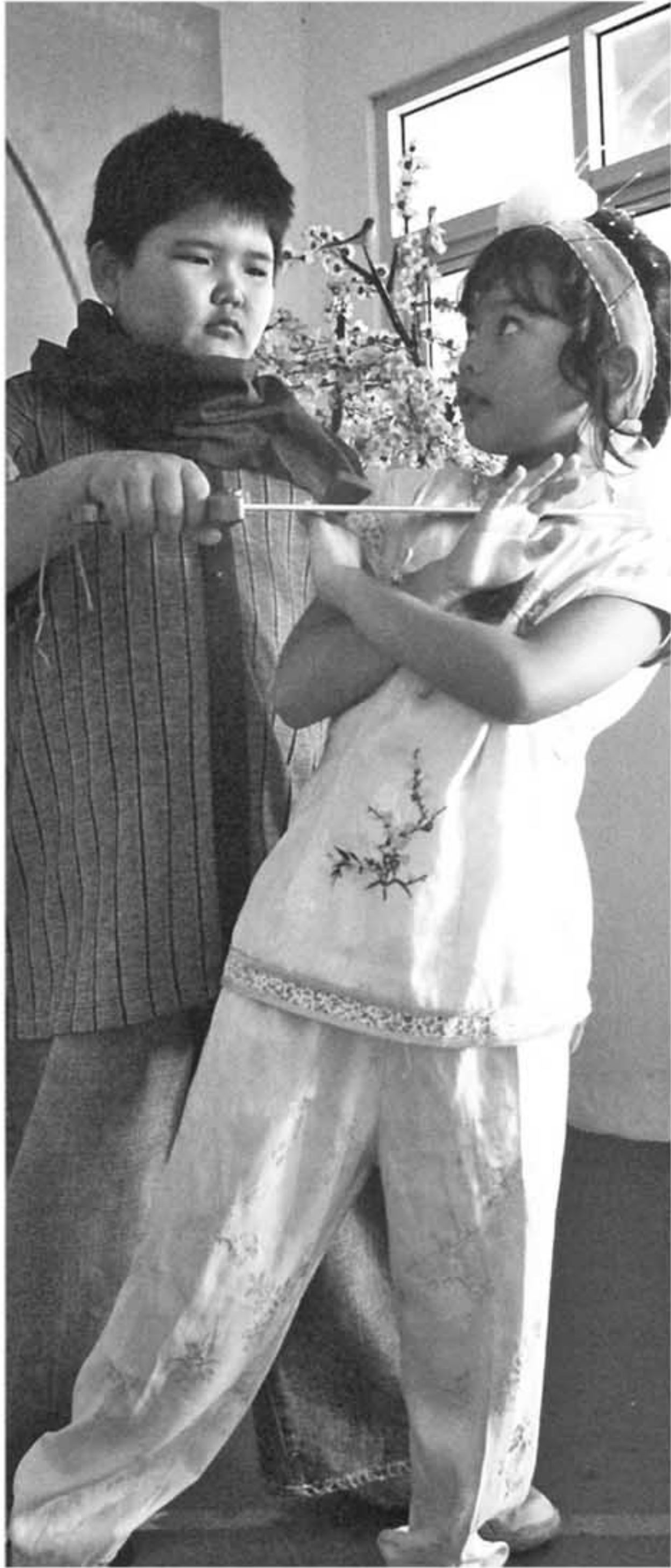
IST DRAMA: Dua siswa SD Bhinneka Tunggal Ika National Plus tengah berakting dalam pementasan drama Dewi Bulan, beberapa waktu lalu.