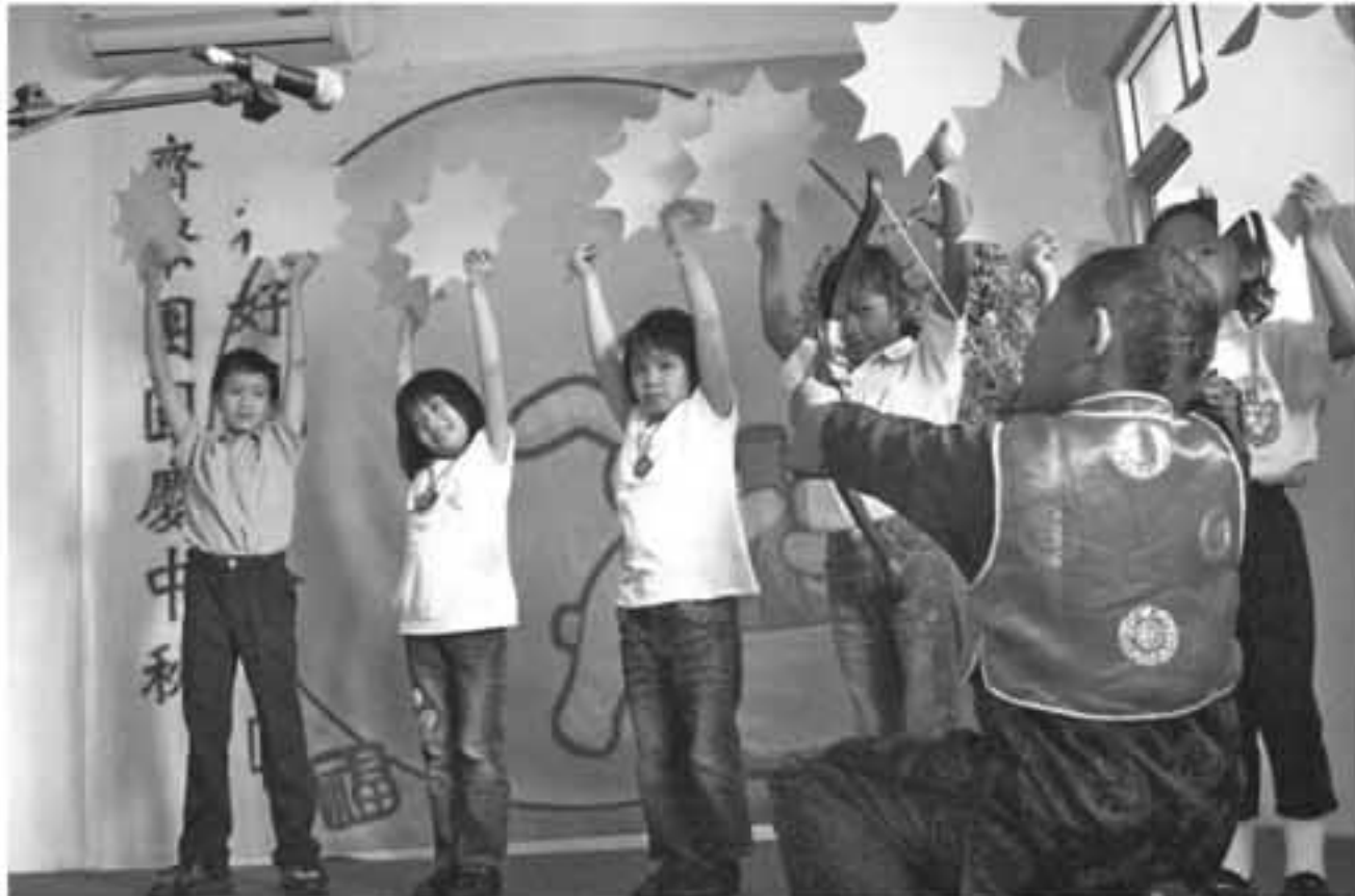
IST DRAMA: Sekelompok siswa-siswi SD Bhinneka Tunggal Ika National Plus tengah mementaskan drama untuk melestarikan budaya.