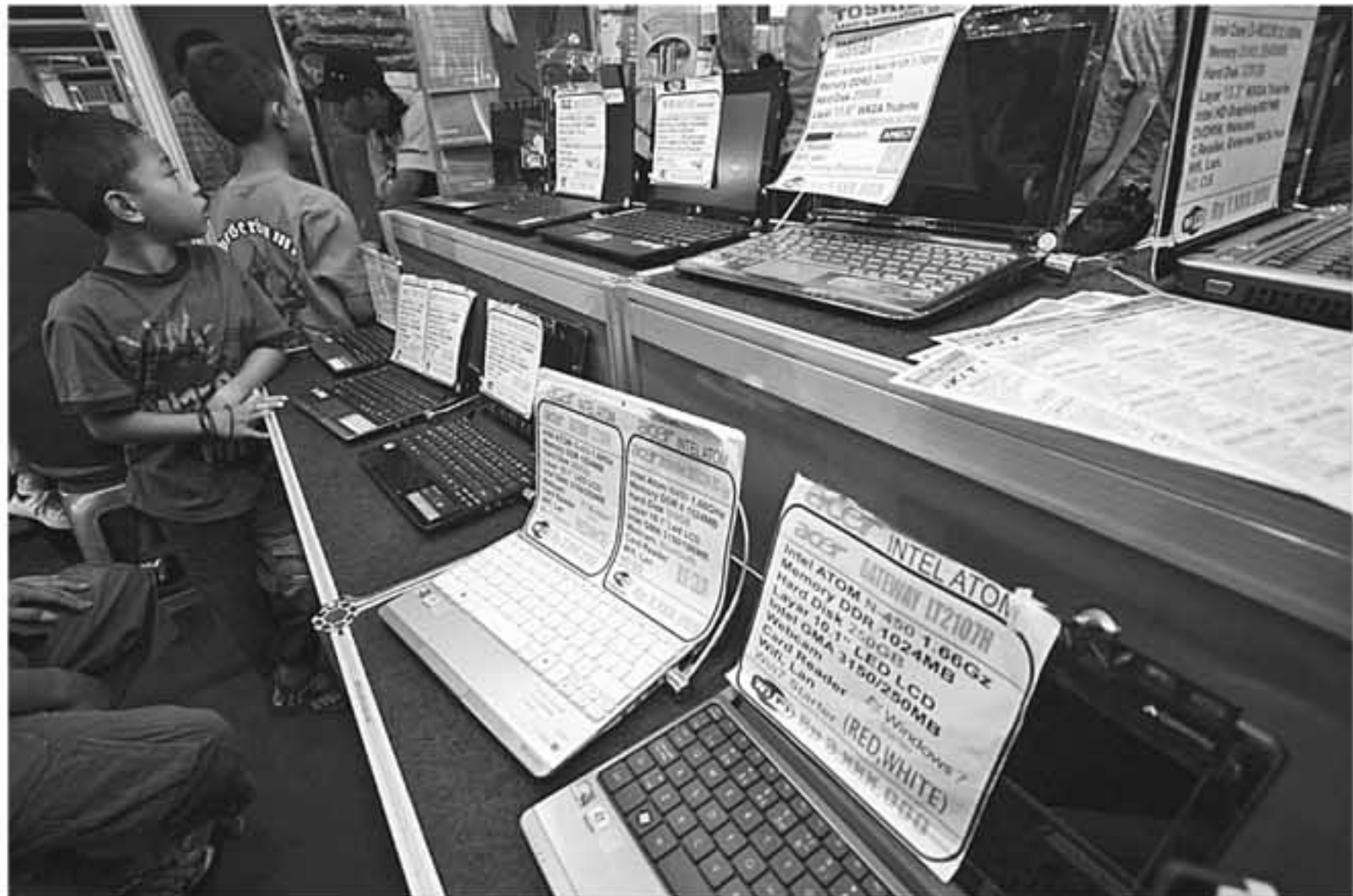
PAMERAN YOGYAKOMTEK: Seorang anak ikut melihat beragam komputer di salah satu gerai pameran Yogyakarta 2010 di gedung JEC, Bantul, Selasa (5/10). Pameran menargetkan penjualan hingga 15.000 unit komputer tersebut akan berakhir hari ini, Rabu (6/10).

Freddy Numberi yang meminta tingkat kesejahteraan masinis ditingkatkan agar tidak mempunyai beban saat menjalankan kereta. “Kami menyambut baik hal itu. Sebetulnya, bukan hanya masinis yang akan pantas mendapat insentif tapi juga pegawai lain yang terkait operasional kereta, seperti petugas command centre dan penjaga perlintasan,” katanya sore ini di sela-sela rapat kerja dengan Komisi V. Menhub Freddy Numberi menuturkan insentif harus diberikan kepada masinis, karena secara psikologis akan sangat membantu saat bekerja. “Masinis akan lebih baik dalam bekerja jika tingkat kesejahteraan meningkat. Saya mengimbau agar masinis bisa dapat insentif,” jelas Menhub.