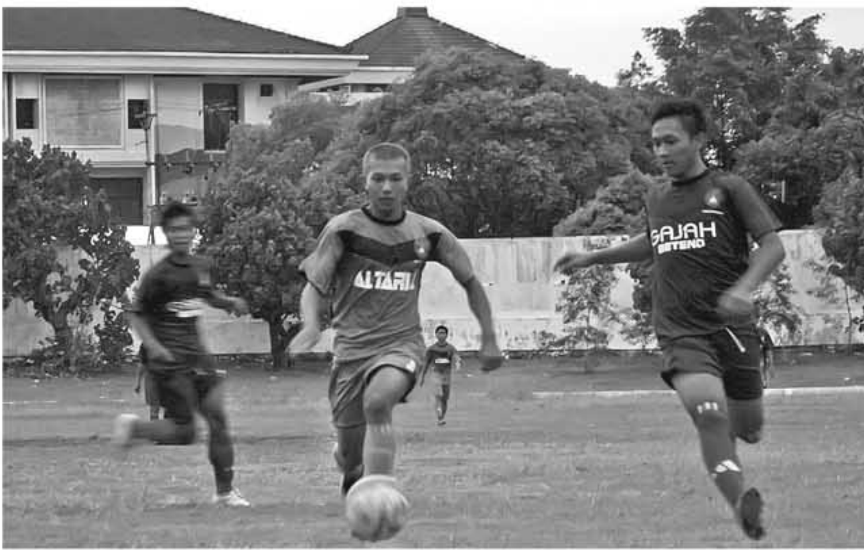
Pemain Altaria (dua kiri) dan pemain Gajah Beteng mengejar bola dalam laga di Stadion Kridosono, Selasa (5/10)