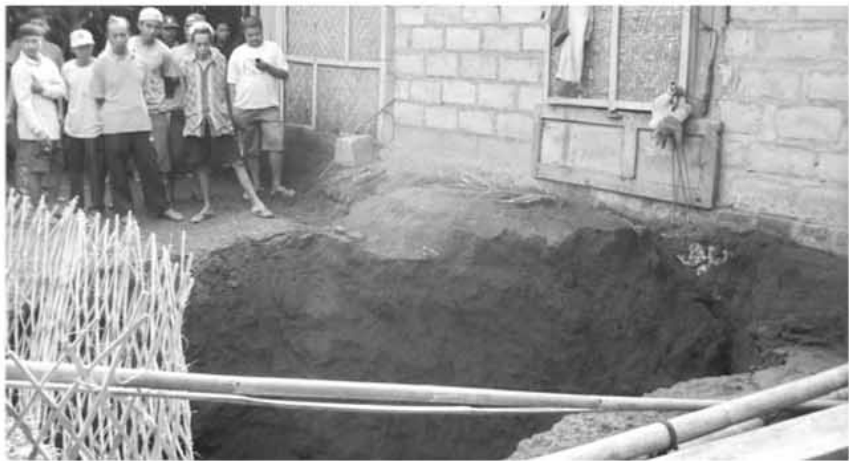
JADI TONTONAN: Sejumlah warga menyaksikan lokasi amblesnya tanah di Girimulyo, Selasa (5/10). Tanah tersebut ambles didekat rumah warga.