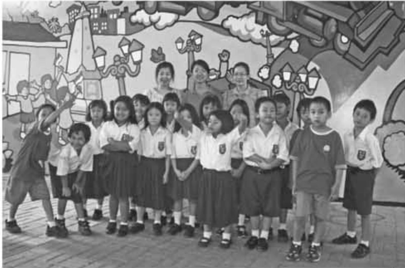
IST SEKOLAH: Para siswa kelas 1 SD Budi Utama berfoto bersama para pengajar bahasa Mandarin, dua di antara pengajar adalah native dari RRC.