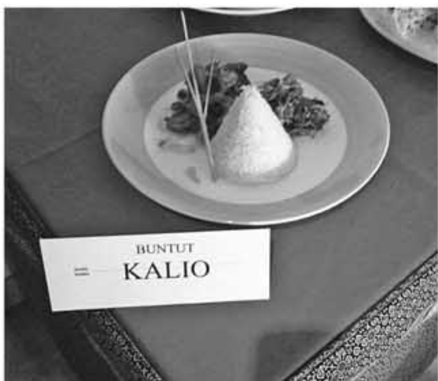
Buntut Kalio salah satu masakan hotel Ibis.

JAKARTA: Kalangan pelaku usaha elektronik di dalam negeri mendesak pemerintah melakukan langkah pengendalian terhadap lonjakan impor produk elektronik yang kian membajani pasar domestik. Banjir produk impor elektronik tersebut diperkirakan akan terus berlanjut sampai akhir tahun seiring dengan penguatan mata uang rupiah yang memicu harga produk impor menjadi lebih murah. Ketua Gabungan Elektronik (Gabel) Ali Subroto Oentaryo mengungkapkan impor produk elektronik yang masuk ke pasar domestik terus mengalami kenaikan signifikan. Lonjakan impor tersebut mulai mencemaskan karena mencatat kenaikan yang sangat signifikan. Berdasarkan data Kementerian Perdagangan, nilai impor barang elektronik selama Januari-Agustus melonjak 83% dibandingkan dengan periode yang sama tahun lalu menjadi US$2,56 miliar. Pada periode yang sama tahun lalu, nilai impor produk tersebut hanya sebesar US$1,4 miliar. “Sudah saatnya impor itu dikendalikan. Pasar menginginkan impor berlebihan, tapi kalau ekspornya tidak mendukung itu berbahaya juga. Dulu mungkin tidak perlu dikendalikan karena posisi ekspor dan impor masih aman tapi sekarang posisinya mengkhawatirkan. Pemerintah harus mengambil langkah-langkah pengendalian, apalagi ini jenis barang konsumsi,” tegas Ali kepada Jaringan Informasi Bisnis Indonesia (JIBI) , Selasa (5/10). ( Bisnis Indonesia /JIBI/MAY)