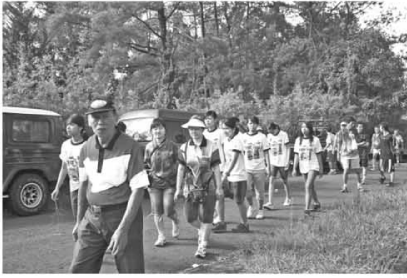
IST Hasher menyusuri rute superlong.