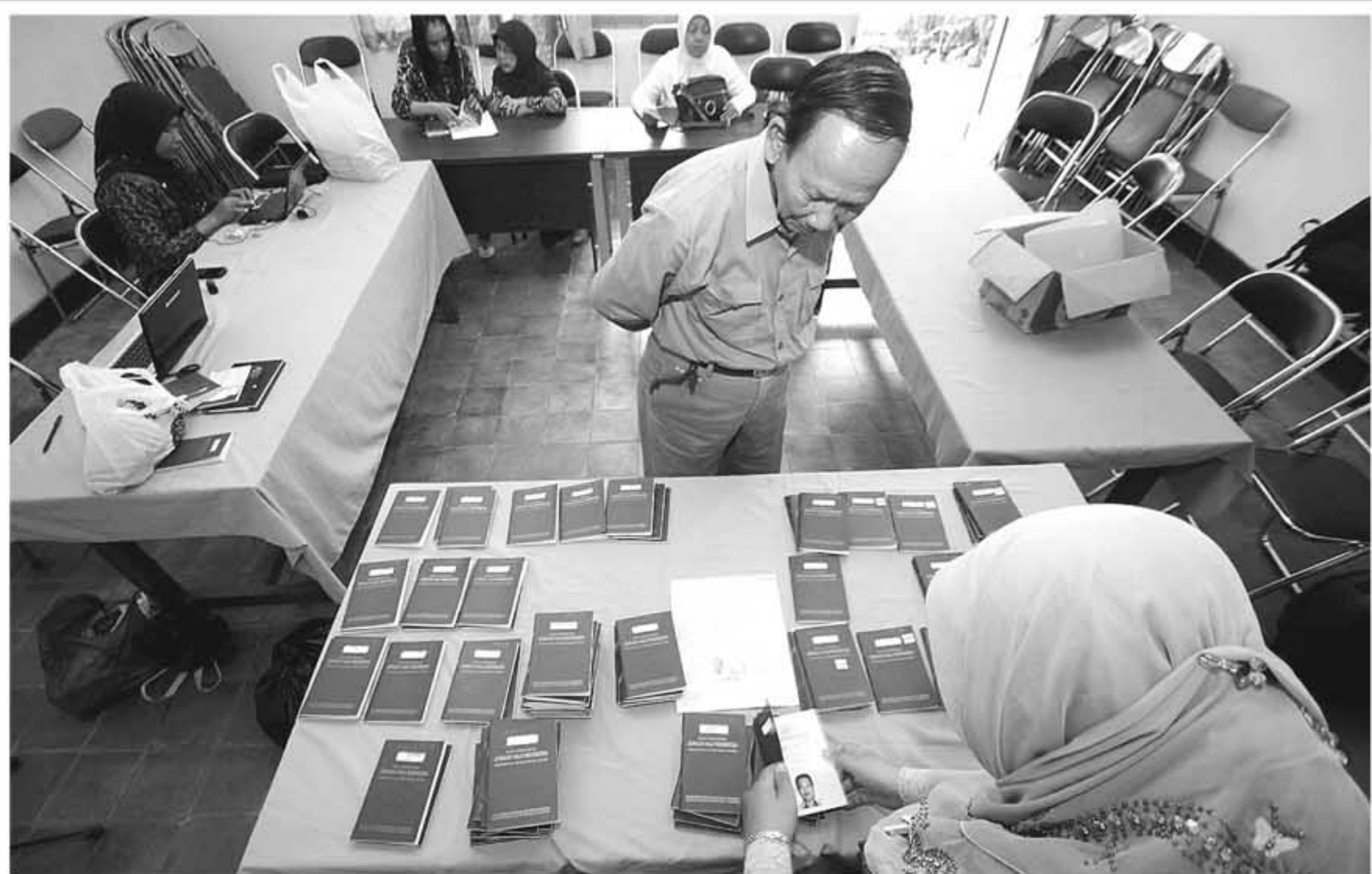
BUKU KESEHATAN: Seorang jemaah calon haji sedang mengambil buku kesehatan miliknya di Kompleks Balaikota, Jogja, Selasa (5/10). Para jemaah calon haji asal Jogja mendapatkan buku kesehatan yang berisi tentang

"Inisiator artinya Karang Taruna dituntut kaya ide membangun kemajuan masyarakat dan daerah. Motivator dengan semangat juang tinggi menuju perkembangan daerah lebih baik serta fungsi pelopor dalam setiap perubahan. "Ada Karang Taruna semua serasa harus jadi lengkap dan ringan," pungkash Walikota.