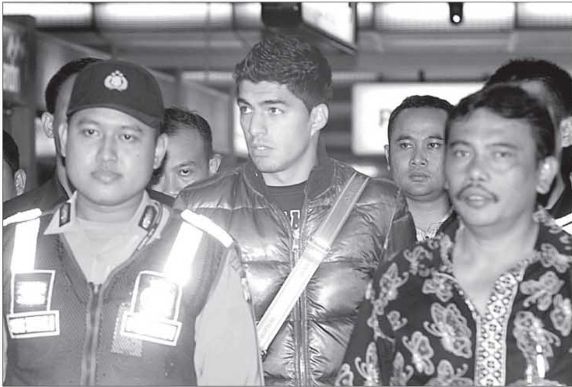
SUAREZ TIBA —Striker Timnas Uruguay yang bermain untuk klub Ajax Amsterdam, Luis Suarez (tengah), tiba di Bandara Internasional Soekarno Hatta, Tangerang, Banten, Selasa (5/10).