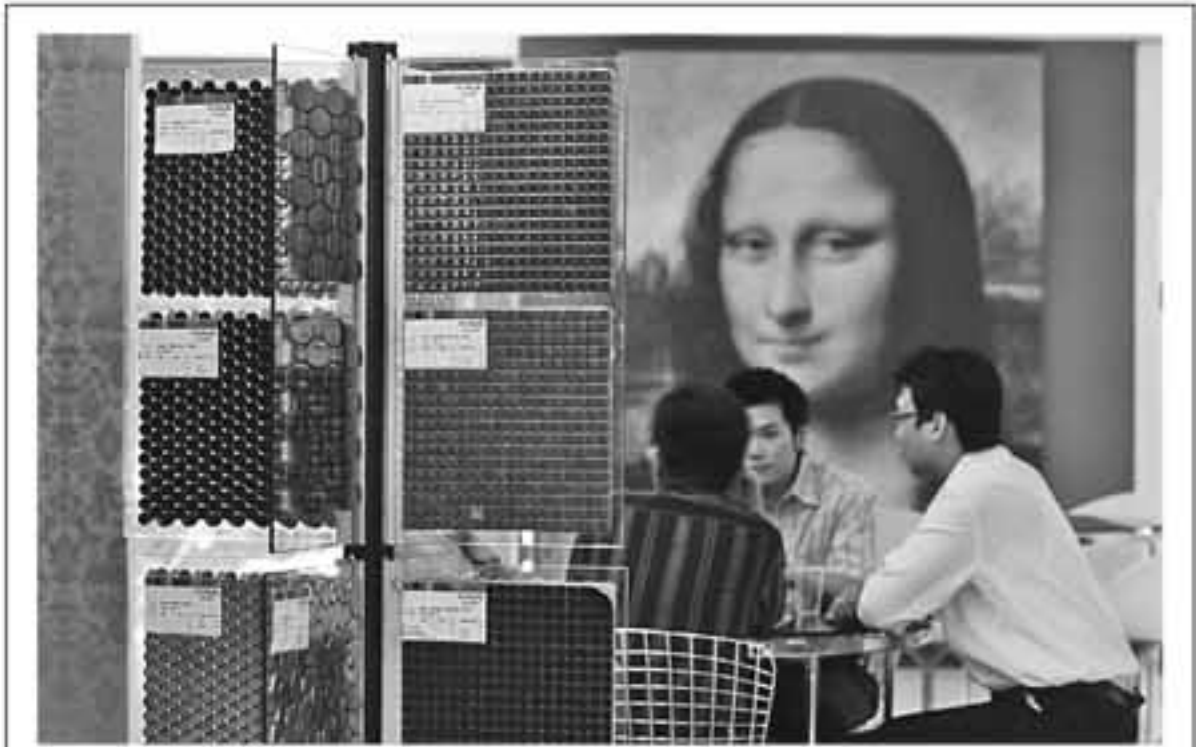
PASAR KERAMIK MEMBAIK: Calon pembeli mengunjungi gerai keramik PT Venus Ceramica Indonesia, di Surabaya, Selasa (5/10). Agen tunggal produk Monalisa Tile dan Venus Tile yang diimpor dari China tersebut menyatakan pasar keramik sepanjang 2010 diprediksikan tumbuh 20%.

Jam pasir dapat digunakan sebagai bahan pelajaran bagi wirausahawan/wati. Usaha yang berhasil berawal dari perencanaan yang baik. Apabila kecepatan usaha dirasakan tidak sesuai dengan rencana, lakukanlah analisis terlebih dahulu sebelum bertindak. Setiap pendirian usaha membutuhkan rencana usaha yang matang. Rencana usaha atau business plan adalah dokumen yang menjelaskan secara rinci tujuan, strategi, sasaran pasar, maupun proyeksi keuangan dari usaha yang dijalankan. Tidak ada rumusan pasti tentang apa yang dicantumkan dalam dokumen rencana usaha. Yang terpenting adalah harus realistis, praktis, dan dievaluasi secara berkala. Jadikanlah dokumen rencana usaha sebagai pedoman agar arah usaha tidak melenceng dan sebagai referensi untuk mengukur keberhasilan usaha. Selain itu, setiap usaha memiliki tahapan perkembangan yang sering disebut sebagai siklus usaha. Bila Anda seorang wirausahawan/wati, Anda adalah bos atas usaha sendiri. Sudah selayaknya Anda memiliki standar ukuran untuk menilai prestasi usaha yang dijalankan. Standar dibuat berdasarkan rencana usaha dalam setiap tahapan siklusnya. Apabila permasalahan di analisis secara tepat, niscaya solusi yang tepat pun dapat diperoleh, sehingga tidak terjadi error atas usaha Anda. Kuncinya adalah, sabar menanti jam pasir mengalir dan memanfaatkan waktu tunggu untuk menganalisis seluruh langkah usaha Anda.