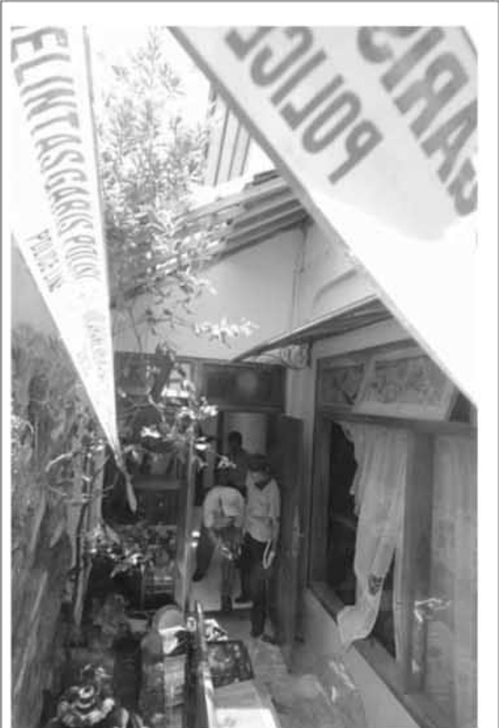
METEOR JATUH: Petugas Labfor Polda Jateng melakukan olah tempat kejadian perkara (TKP) kasus dugaan batu meteor jatuh di Ngringo, Jaten, Karanganyar, Selasa (5/10). Petugas juga mengamankan sejumlah barang bukti berupa tabung gas ukuran 12 kg dan selang regulator.