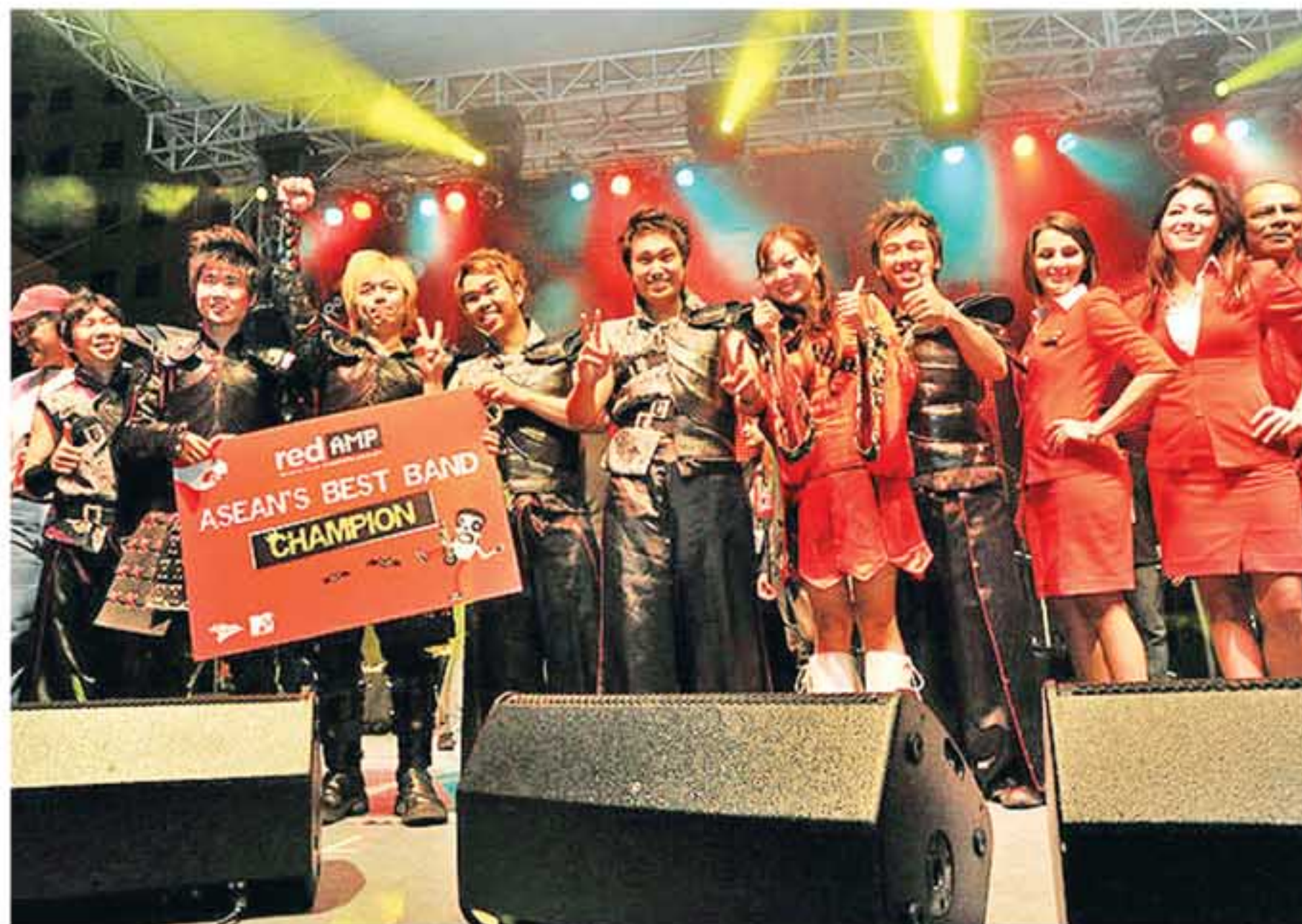
SUKSES: Golden Dragon Band berhasil menjadi pemenang MTV Redamp Are You Asean's Best Band? pada Juli 2010 lalu di tingkat ASEAN. Melalui ajang ini, band asli Jogja ini ingin menegaskan jika mereka bagian dari Indonesia.

"Saya pikir wajar kalau orang Batak suka lagu-lagu Batak. Orang Sunda dan sebagainya juga sepe-