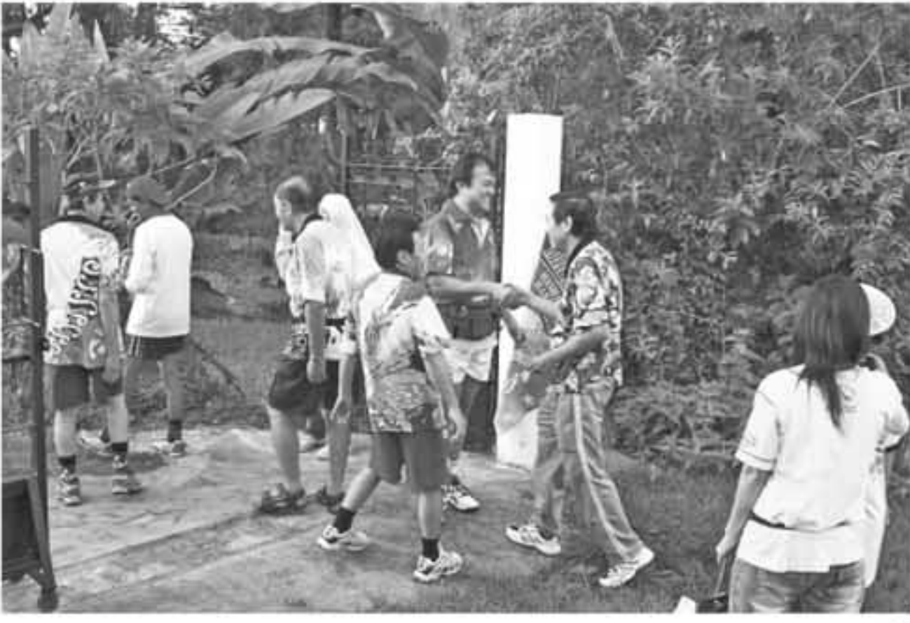
IST KEDATANGAN : Para peserta ACC Superlong Run memasuki area Hash House Harrier di ACC Land, Kaliurang (26/9).